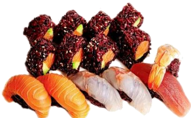
BOX VENERE € 16.9