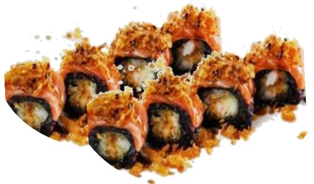
A14. BLACK PANDA 6.5€ | 11.9€ gambero fritto ricoperto salmone, cipolla fritta e salsa teriyaki