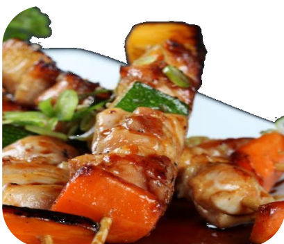
F14. BRANZINO GRILL 8€