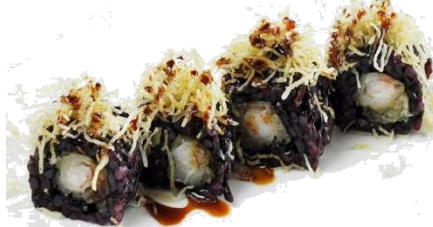
Black Ebiten (8pz)