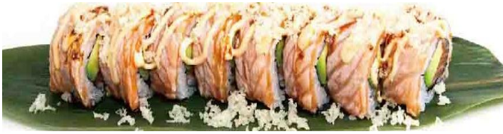
A1. SALMON PLUS 6.5€ | 11.9€ salmone, avocado ricoperto con salmone scottato e salsa teriyaki

inside-out roll con sesamo, porzioni da 4 | 8 pezzi