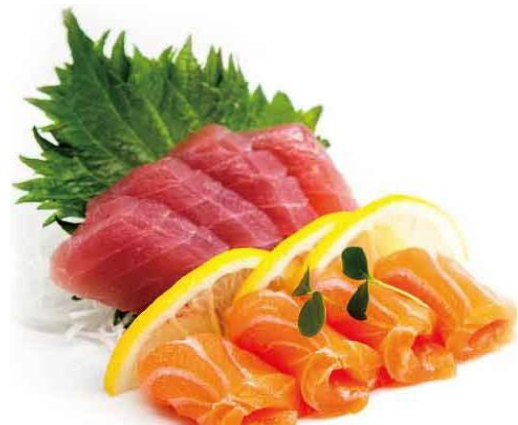
S10. SASHIMI SAKE TUNA € 11.9