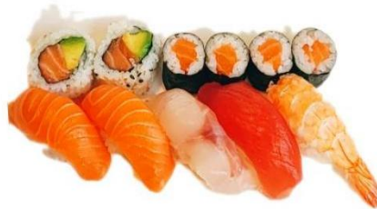
S2. SUSHI MISTO €10