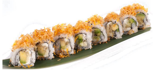
A12. SWEET ROLL 🍌 5.5€ | 10€ mango, avocado, philadelphia granelle di patate