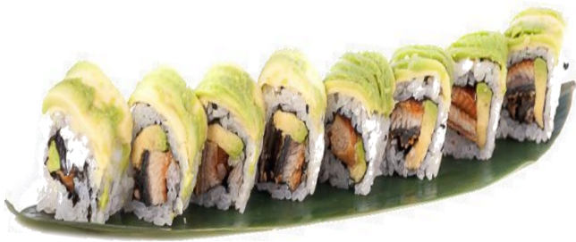
A9. ANGUILLA ROLL 7€ | 13€ anguilla, avocado e teriyaki

inside-out roll con sesamo, porzioni da 4 | 8 pezzi