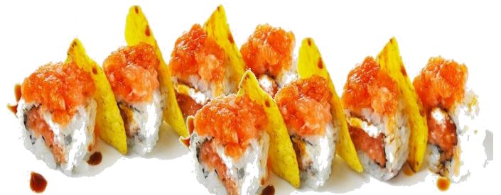
A6. HOT SPICY ROLL 🌶️🌿 7€ | 13€ double salmone spicy, philadelphia, nachos e la salsa teriyaki