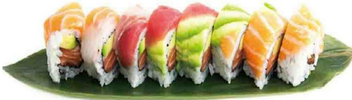
A3. RAINBOW ROLL 🌿 6.5€ | 11.9€ salmone, avocado e pesce misto