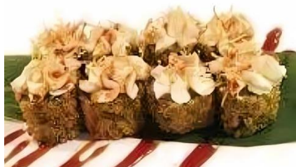
Hosomaki Fritto (8pz)