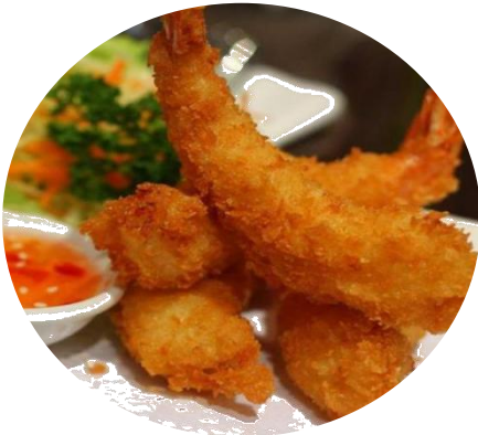
F5. EBI MONO 8€ gamberi fritti al panko 10pz