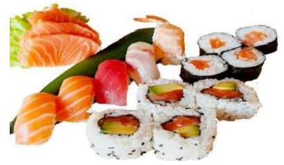
BARCA 1(16PZ) € 15.9