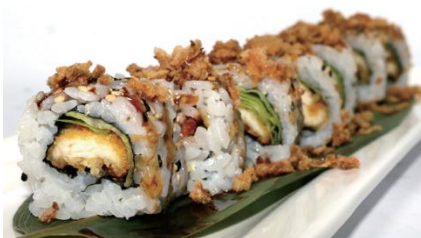
Chicken Roll (8pz)