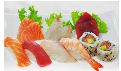
S3. SUSHI SASHIMI € 14.9