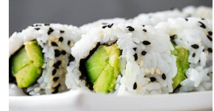
Uramaki Veggie (8pz)