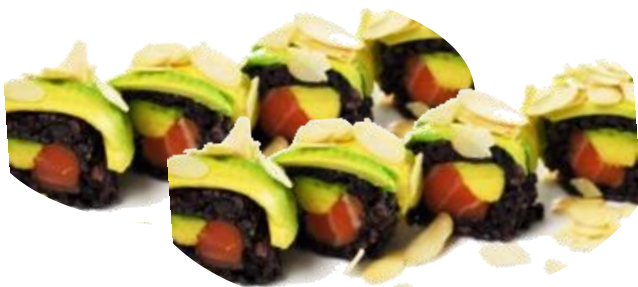
A15. BLACK MANDO 6.5€ | 11.9€ salmone, avocado e mandorle