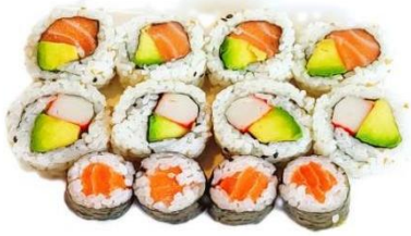
S1. MAKI MISTO €9