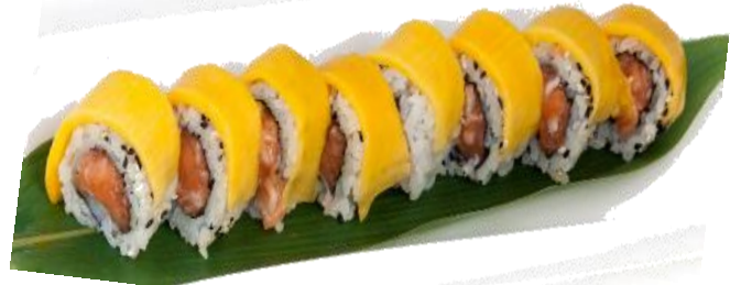
A4. MANGO ROLL 🌿 6€ | 11€ salmone, philadelphia, mango