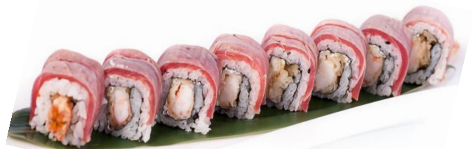
A8. TATAKI ROLL 🍣 7€ | 13€ gamberoni fritti, philadelphia, tonno scottato, teriyaki e la salsa teriyaki