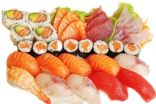
BARCA A (31PZ) € 31.9

10 nighiri misto, 9 sashimi misto 8 hosomaki, 4 uramaki misti