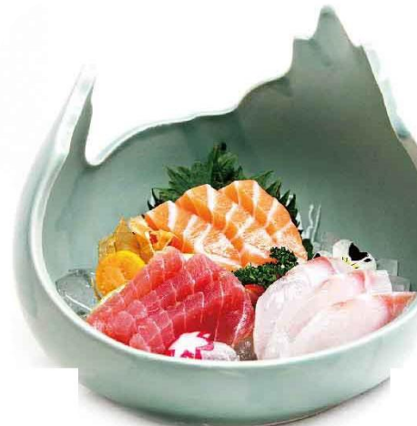
S8. SASHIMI MISTO € 12

5 fette salmone alla fiamma, pistacchio e salsa zaffarano