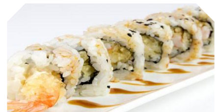
Uramaki a scelta (8pz)