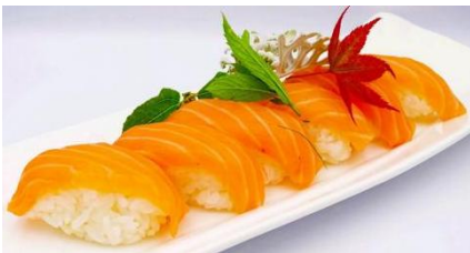
Sushi Sake (6pz)