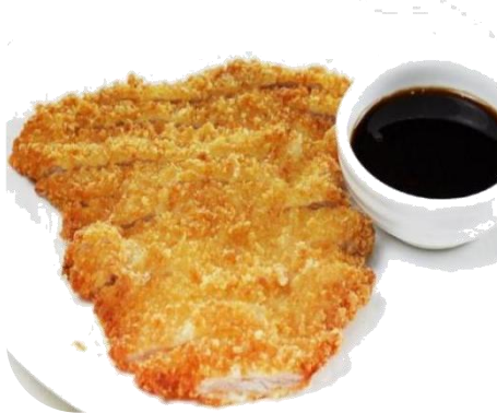
F6. COTOLETTA 8€ cotoletta di maiale fritto