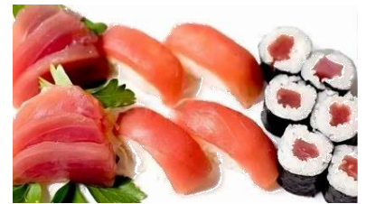
S6. SET TONNO(18PZ) € 16.9