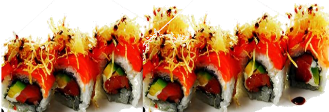
A5. MIYA ROLL 🌶️ 6.5€ | 11.9€ salmone, philadelphia, avocado, granelle patate, spicymayo e teriyaki