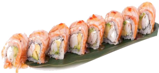
A11. SAKEBI ROLL 🍣 7€ | 13€ gambero cotto, philadelphia avocado, salmone scottato