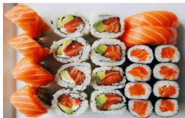
BOX SAKE (22PZ) € 18

4 uramaki ebiten, 4 uramaki sake cotto e philadelphia, 4 uramaki california, 8 hosomaki surimi, 2 nigiri gamberi