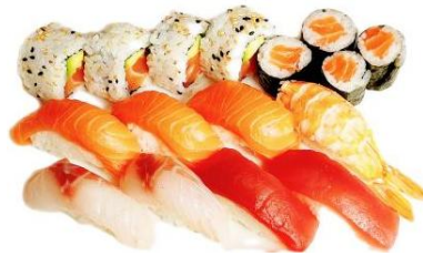
SUSHI MEDIO(16PZ) € 15.9