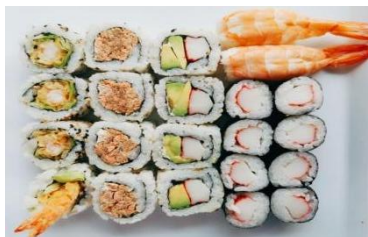
BOX COTTO (22PZ) € 16

4 uramaki ebiten, 4 uramaki sake cotto e philadelphia, 4 uramaki california, 8 hosomaki surimi, 2 nigiri gamberi