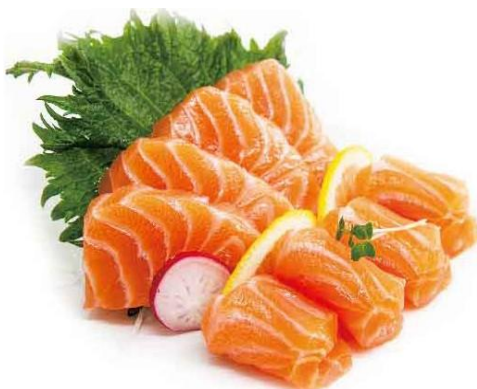
S9. SASHIMI SAKE € 10