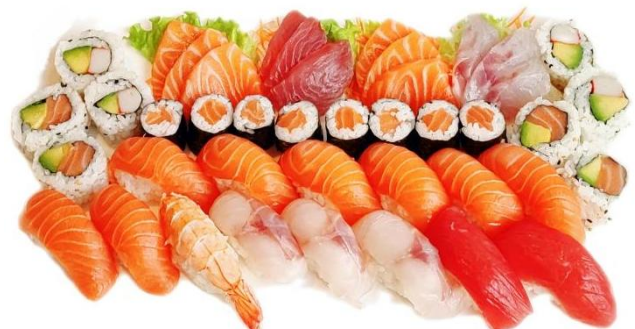
BARCA B (44PZ) € 42.9

10 nighiri misto, 9 sashimi misto 8 hosomaki, 4 uramaki misti