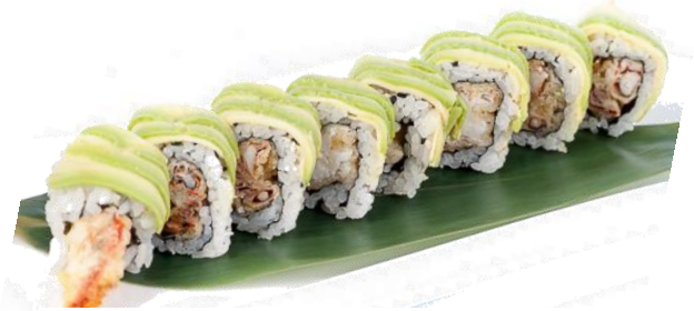
A10. DRAGO ROLL 🍣 6€ | 11€ gamberoni fritti, avocado e salsa teriyaki