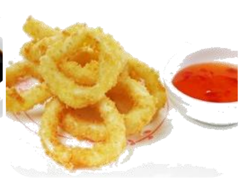
F7. IKA FURAI 8€ calamari fritti 10pz