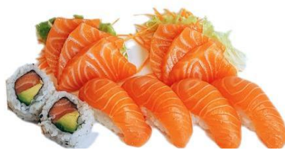
S5. SET SAKE € 13.9