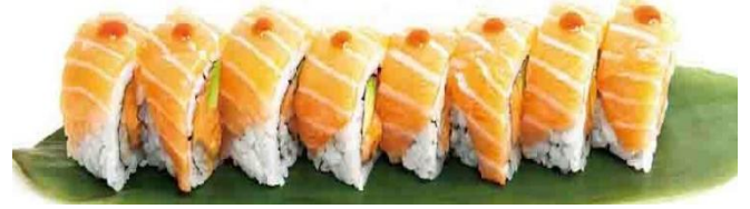
A2. GENJI ROLL 🌿🌶️ 6.5€ | 11.9€ spicy salmone e avocado ricoperto con salmone