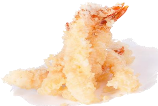
F8. EBI TEMPURA 9€ gamberoni fritti 4pz