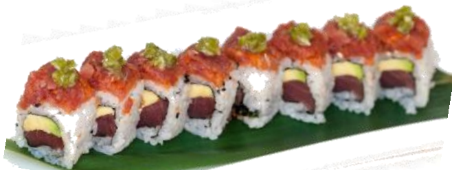
A7. WASABI ROLL 🌿🌶️ 7€ | 13€ tonno, avocado ricoperto con spicy tonno e wasabi fresco