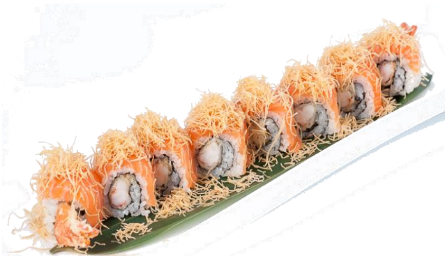
A13. EBI SPECIAL 🍣 6.5€ | 11.9€ gambero fritto, salmone scottato granelle patate e salsa teriyaki