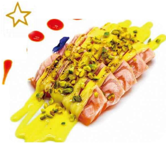
S7. SASHIMI FIAMMA € 6.9

5 fette salmone alla fiamma, pistacchio e salsa zaffarano