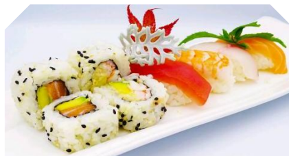
Sushi Misto (8pz)