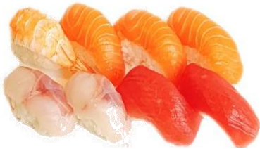
S4. NIGHIRI MIX € 9.9