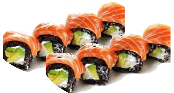
A16. BLACK SOFT 🍌 6.5€ | 11.9€ avocado, philadelphia ricoperto salmone